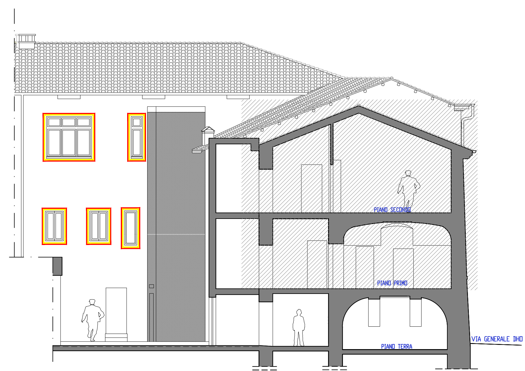
SOVRAPPOSIZIONI_Sezione BB scala 1:100