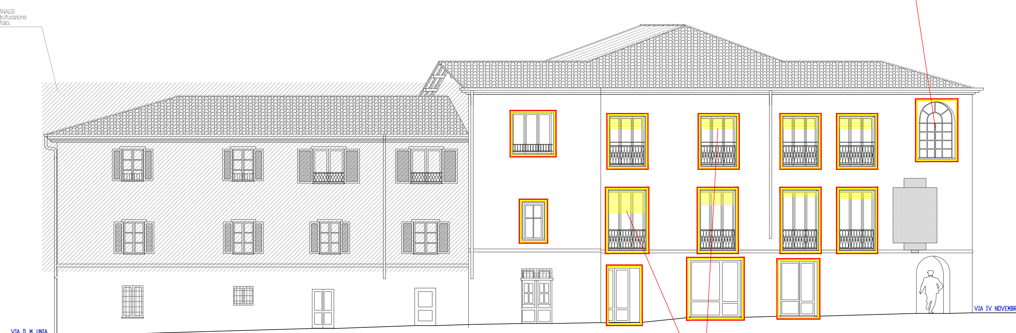
SOVRAPPOSIZIONI_Prospetto frontale a Ovest scala 1:100