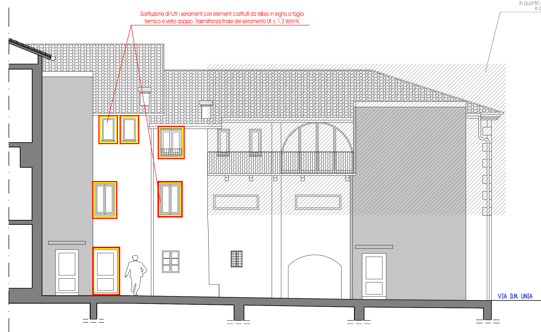
SOVRAPPOSIZIONI_Prospetto retrostante ad Est scala 1:100

Via Marengo n.95 - 12073 Ceva (CN) Tel/Fax 0174 721999 - e-mail: info@spaziokubo.com