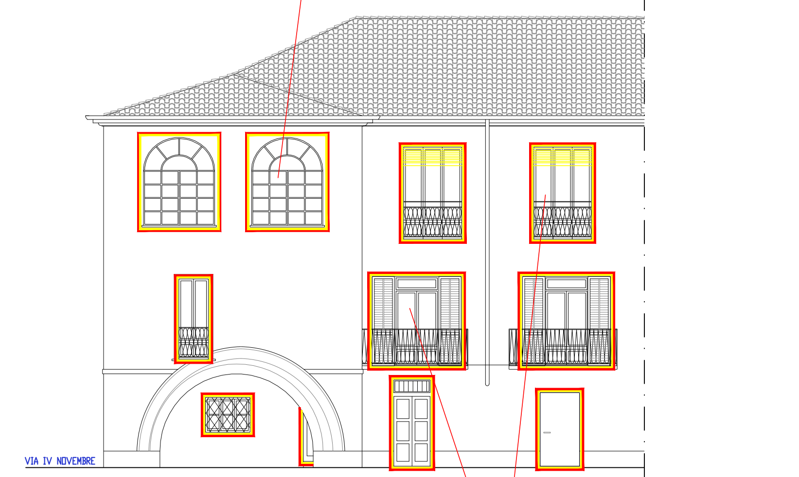
SOVRAPPOSIZIONI_Prospetto laterale a Sud scala 1:100