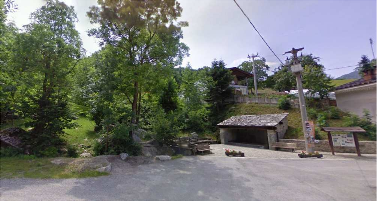
altra immagine del contesto dell'opera