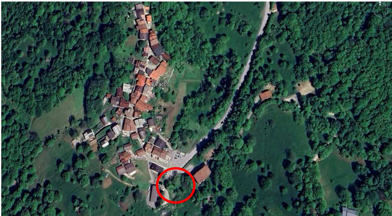
vista satellitare con individuazione dell'area oggetto di intervento

Si riporta una serie di immagini a descrizione dello stato dei luoghi attuale